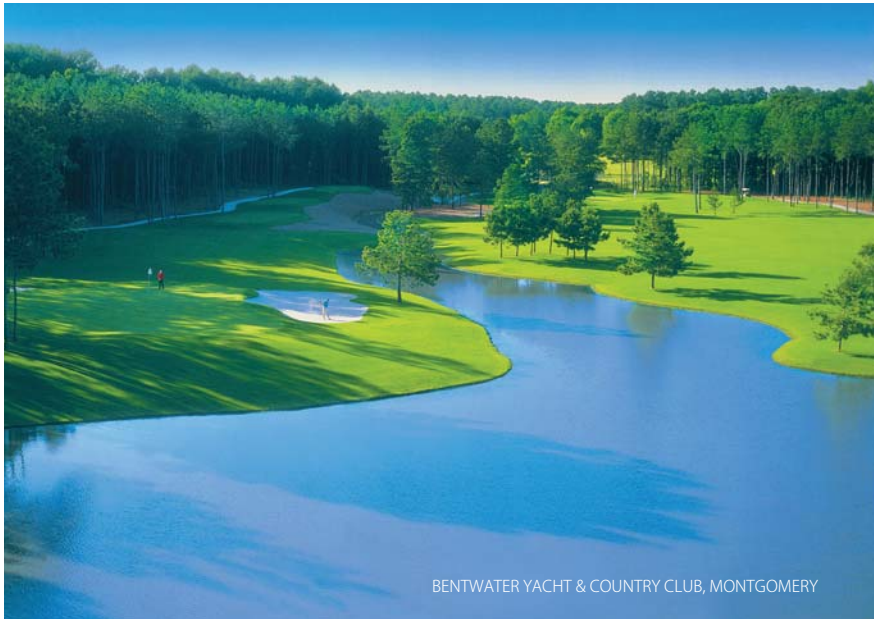
BENTWATER YACHT & COUNTRY CLUB, MONTGOMERY